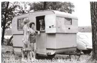
Zühlsdorf, Eich