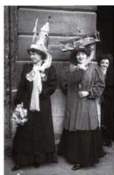
Catherinettes à Paris 1909

Et hors de question de vivre seul(e), à moins d'être prêt(e) à affronter le regard de la société: on est alors un(e) raté(e) ou un(e) libertin(e).