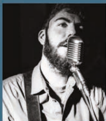
Eddy Kaiser Band