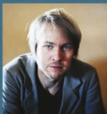
Peter von Poehl

avec deux albums, une Victoire de la musique (Révélation du public) et quelques centaines de concerts, ce géant blond à la voix douce maîtrise l'art du contraste. L'artiste globetrotteur n'a pas son pareil pour délivrer ses chansons avec intensité.