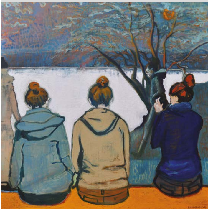
L'Espace du temps VIII

Jusqu'au 22 novembre au Château de Tours (tous les jours de 14h à 18h sauf lundi et 1er/11 novembre). Entrée libre.